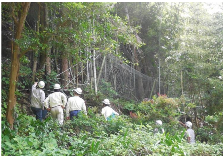
(写真③) 日の出町大久野地区