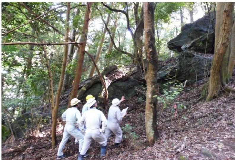
(写真②) 奥多摩町海沢地区